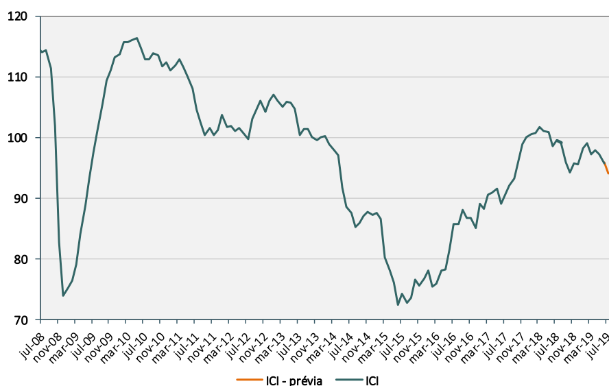
Índice de Confiança da Indústria (Dados de jul/08 a jul/19, dados dessazonalizados)

O resultado negativo do índice neste mês seria determinado tanto pela piora na percepção dos empresários em relação à situação atual quanto pelas perspectivas futuras dos negócios. O Índice da Situação Atual (ISA) cairia 2,5 pontos, para 94,1 pontos, o menor valor desde outubro de 2018 (93,4 pontos). Por sua vez, o Índice de Expectativas (IE) diminuiria 0,9 ponto, para 93,9 pontos, o menor nível desde julho de 2017 (93,1 pontos).