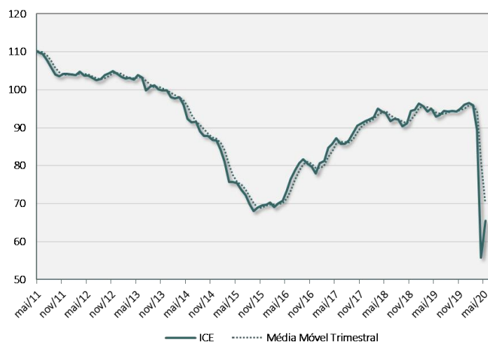
Índice de Confiança Empresarial (Dados de mai/11 a mai/20, dessazonalizados)