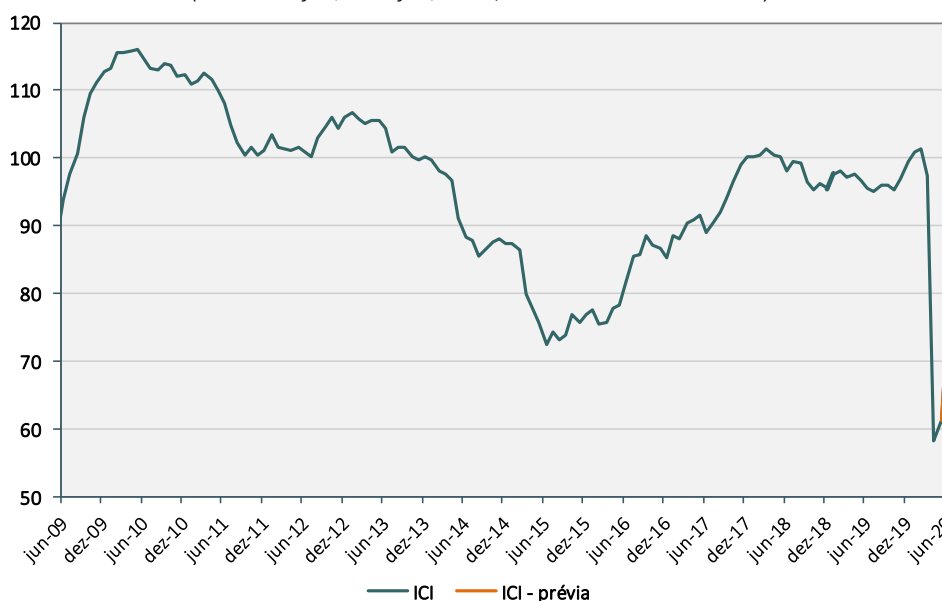
Índice de Confiança da Indústria (Dados de jun/09 a jun/2020, dados dessazonalizados)

O avanço da confiança em junho é resultado da melhora da avaliação dos empresários em relação ao presente e, principalmente, para os próximos três e seis meses. O Índice de Expectativas apresenta variação de 20,6 pontos, para 75,5 pontos, recuperando nos últimos dois meses mais da metade da queda observada em abril. Já o Índice de Situação Atual teria recuperação menos expressiva do que o IE, de 9,2 pontos, para 77,8 pontos, o equivalente a um terço da perda de abril.