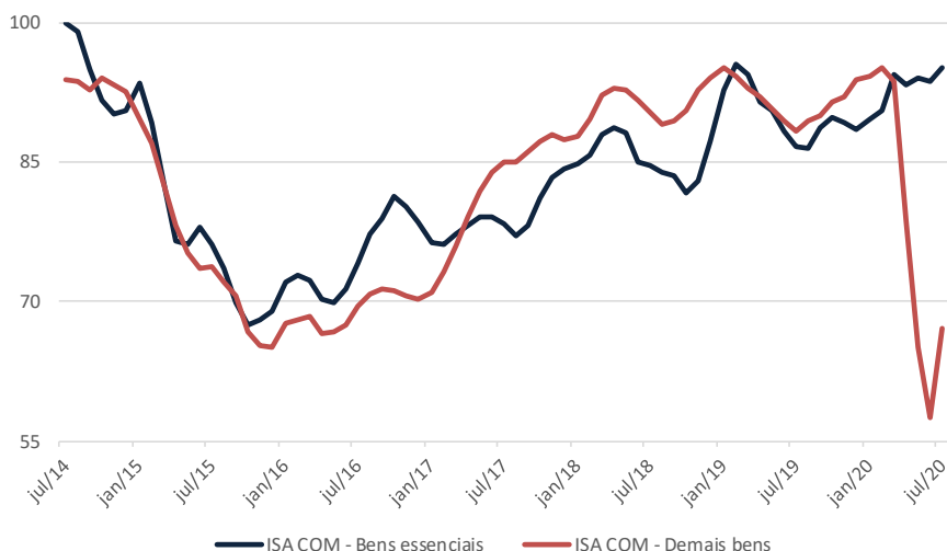
Índices de Situação Atual dos revendedores de bens essenciais e demais bens (Dados dessazonalizados, em médias trimestrais)

A edição de julho de 2020 coletou informações de 765 empresas entre os dias 1 e 23 deste mês. A próxima divulgação da Sondagem do Comércio ocorrerá em 25 de agosto de 2020.