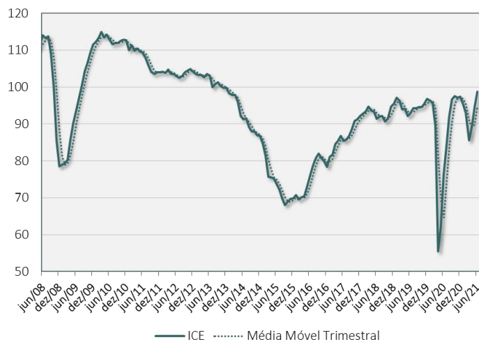
Índice de Confiança Empresarial (Dados de jun/08 a jun/21, dessazonalizados)