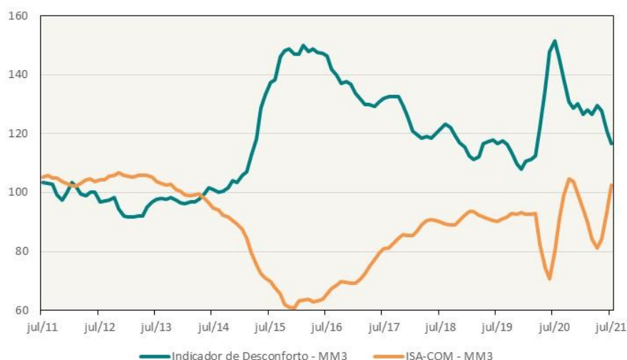
Indicador de Desconforto e Índice de Situação Atual (Dados dessazonalizados, em médias móveis trimestrais)

A edição de julho de 2021 coletou informações de 800 empresas entre os dias 1 e 23 deste mês. A próxima divulgação da Sondagem do Comércio ocorrerá em 30 de agosto de 2021.