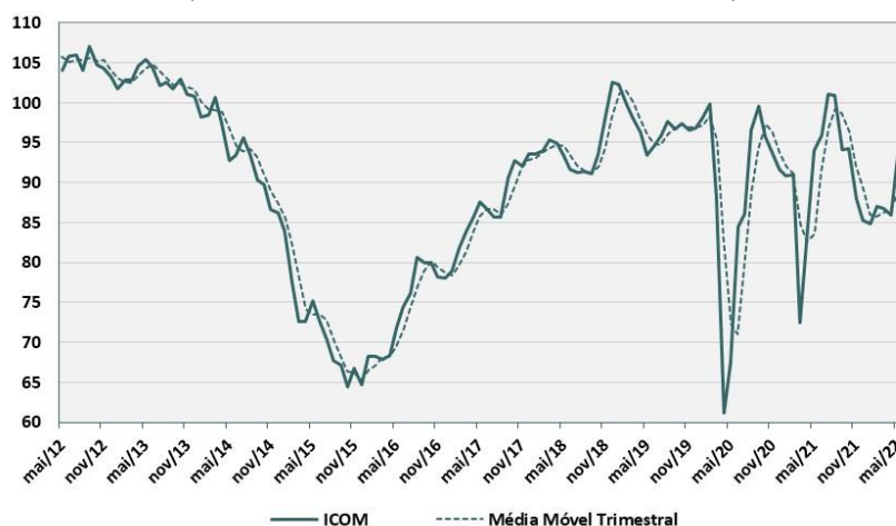
Índice de Confiança do Comércio (Dados de mai/12 a mai/22, dessazonalizados)

“A confiança do comércio voltou a subir em maio após dois meses em queda. A melhora ocorre tanto na avaliação dos empresários em relação ao momento atual quanto por melhores perspectivas futuras. O ISA ultrapassa os 100 pontos influenciado pela recuperação da demanda pelo terceiro mês consecutivos. Apesar da alta do IE, ela reflete apenas uma redução do pessimismo dos empresários, já que o índice permanece em patamar mais baixo. A liberação de recursos pode estar ajudando o cenário favorável do segundo trimestre, mas a continuidade para o médio prazo ainda depende de reduções da incerteza, melhora da confiança do consumidor e evolução das variáveis macroeconômicas”, avalia Rodolpho Tobler, economista do FGV IBRE.