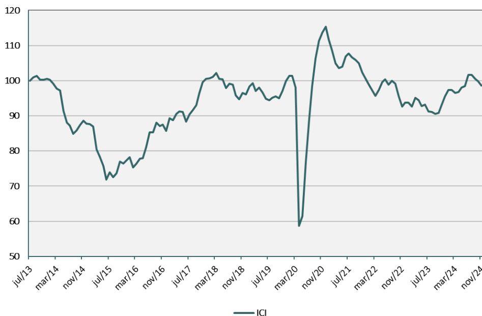
Índice de Confiança da Indústria (Dados de jul/13 a nov/24, dessazonalizados)